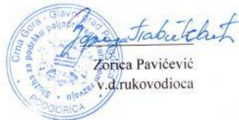
Zorica Pavićević v.d.rukovodioca

Uputstvo o pravnoj zaštiti: Protiv ovog Rješenja može se izjaviti žalba Agenciji za zaštitu ličnih podataka i slobodan pristup informacijama u roku od 15 dana od dana prijema rješenja, preko ove Službe. Žalba se podnosi u 2 primjerka sa dokazom o uplati 3,00 eura administrativne takse na uplatni račun Glavnog grada – Podgorice, shodno Tarifnom broju 2 Odluke o lokalnim administrativnim taksama Glavnog grada – Podgorice („Sl.list CG – opštinski propisi“, broj 54/19).